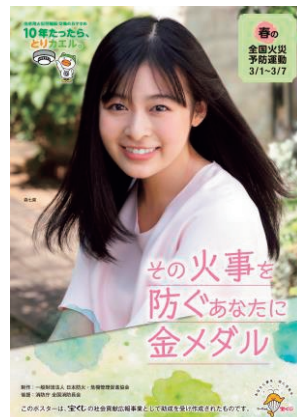
火災予防運動ポスター