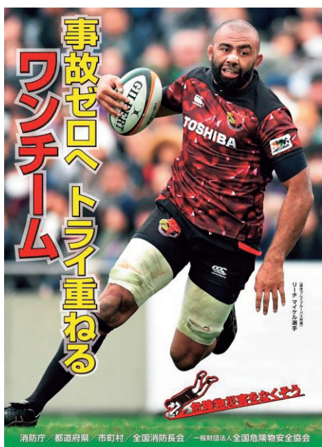
危険物安全週間推進ポスター

また、各地域においては、新型コロナウイルス感染症拡大防止に留意しつつ、危険物関係事業所の従業員や消防職員を対象とした講演会や研修会が開催されたほか、消防機関による危険物施設を対象とした立入検査や自衛消防組織等と連携した火災等を想定した訓練が行われた。